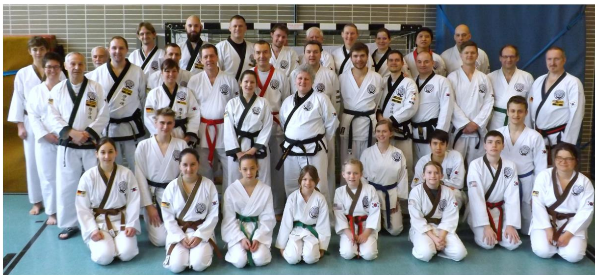
Gruppenfoto der Lehrgangsteilnehmer