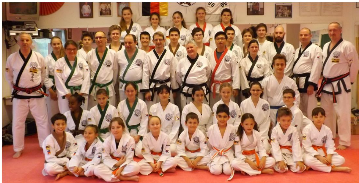
Alle Prüfungsteilnehmer mit Prüfern

Anders als bei unserer ersten Gup-Prüfung waren wir nun bereits mit der Situation vertraut und deshalb nicht mehr gleichermaßen nervös. Denn die Gewissheit nicht "alleine" dazustehen, sondern gemeinsam unser Bestes zu geben, sowie die vielen vertrauten Gesichter, die sich nicht sonderlich verändert hatten anders als ihr und auch unser Gürtelgrad, ein Symbol des Fortschritts, bestärkten uns.