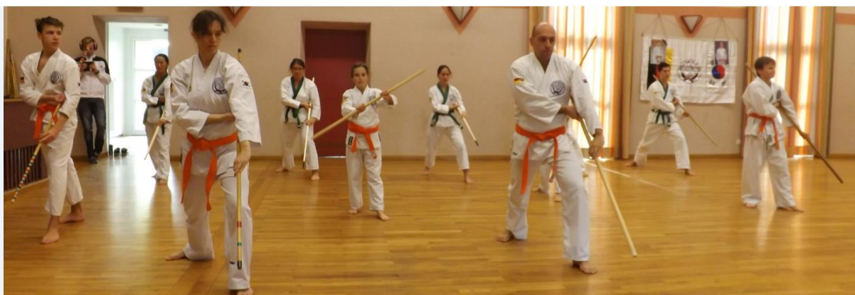
Gruppe der Farbgurte beim Üben der Grundtechniken

Am 14.11.2015 fand ein Waffenlehrgang in Leitershofen statt. Zu diesem waren wieder viele Teilnehmer erschienen sogar aus Hamburg. Um einen ausgewogenen Lerninhalt zu vermitteln, wurden 2 Gruppen gebildet. Was erstaunlich war, ist, dass auch sehr viele untere Farbgurte (Orange) erschienen waren. Für den Lehrgangsleiter war dies auch eine, glaube ich, anspruchsvolle Aufgabe, zwischen denen, die mit dem Stock noch nicht so oft umgehenden Schüler und den weiter lernenden